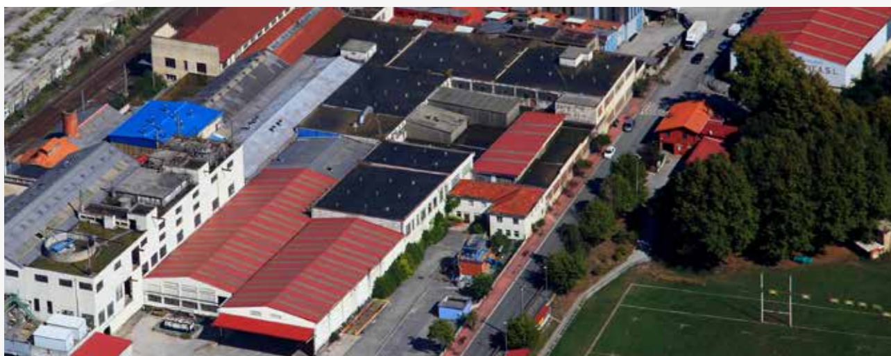
PLANTA COMINTER TISÚ, S.L. en Hernani (Gipuzkoa)