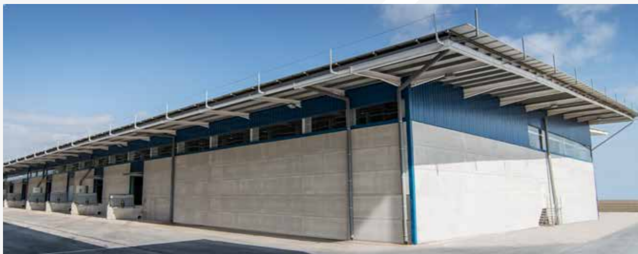
PLATAFORMA LOGÍSTICA en Onda (Castellón)

En Grupo Cominter no sólo nos preocupamos por el medio ambiente, sino que también nos ocupamos de él. Actuamos directamente sobre los principales ejes de la industria en materia de sostenibilidad: