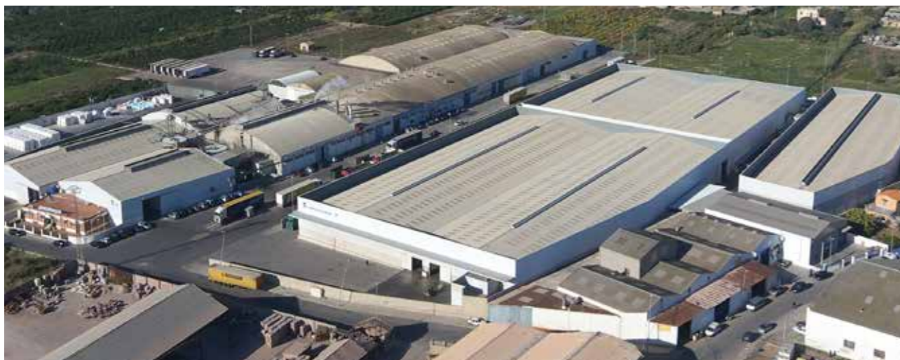
PLANTA KARTOGROUP ESPAÑA, S.L. en Burriana (Castellón)